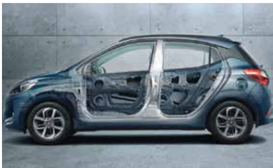
Hệ thống khung mới cứng vững hơn với thép cường độ cao AHSS