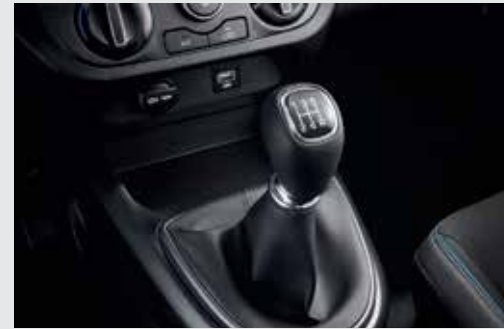
Hộp số sàn 5 cấp

Mang đến khả năng vận hành bền bỉ và tiết kiệm nhiên liệu