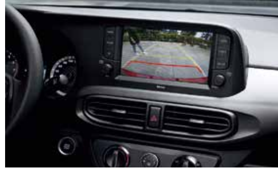
Camera lùi hỗ trợ đỗ xe