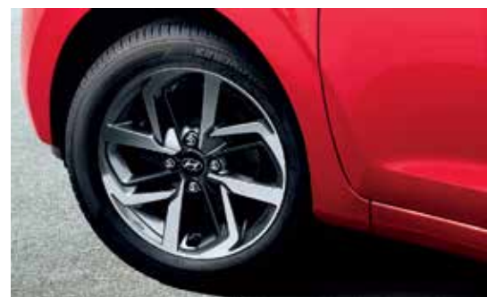
Hệ thống cảm biến áp suất lốp