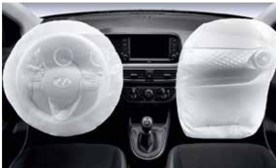
Hệ thống an toàn 2 túi khí